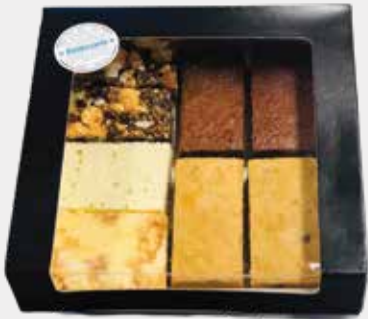
8 repen en blokken box: €16,-