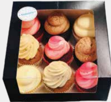
9 cupcake box: €20,-