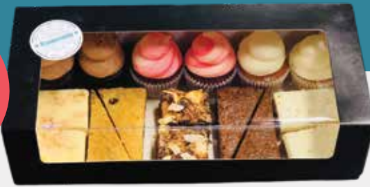
Mini mixbox: €17,50