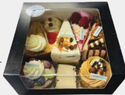
Gebak box 8 stuks: €22,-