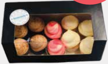
10 mini cupcake box: €12,-