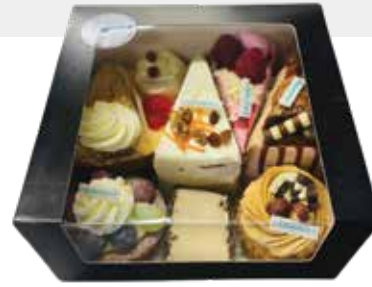
Gebak box 8 stuks: €22,-