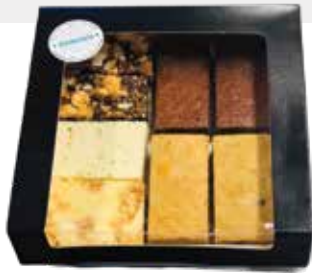
8 repen en blokken box: €16,-