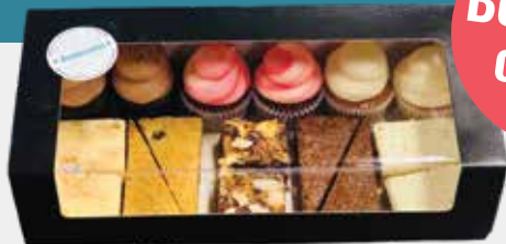
Mini mixbox: €17,50