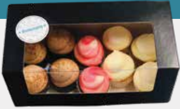
10 mini cupcake box: €13,-