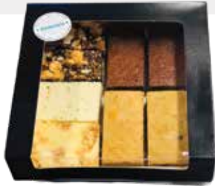
8 repen en blokken box: €17,20