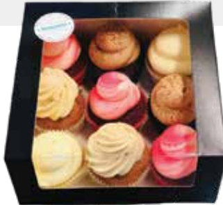
9 cupcake box: €21,15